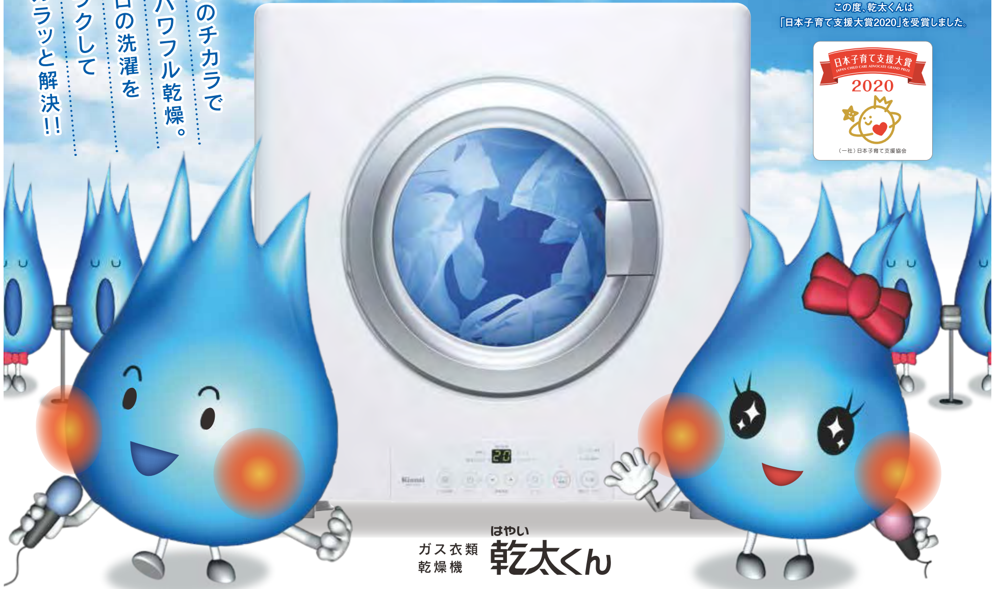
はやい ガス衣類乾燥機 乾太くん